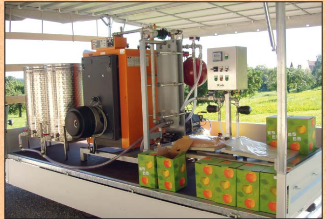
Rechtsabfüllung PK 1000 – Dosierautomat DF 1000