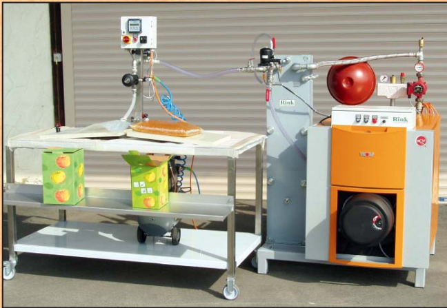
Linksabfüllung PK 750 – Dosierautomat EF 600