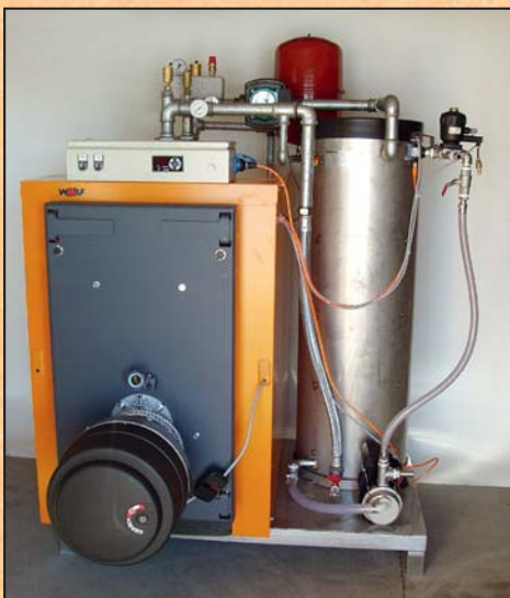
PK 1200 KRWT

Rink Spezialist für Fruchtsaftherstellung